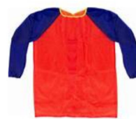
Une blouse, tee-shirt ou chemise usagée