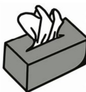
2 boîtes de mouchoirs