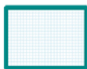
1 ardoise blanche