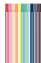
12 feutres dans une trousse