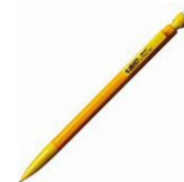
1 critérium 0.7mm avec mines