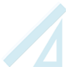
1 règle et 1 équerre plastiques (non flexible)