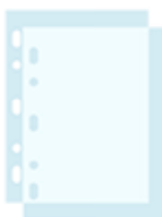
30 pochettes transparentes