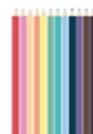
12 crayons de couleur dans une trousse