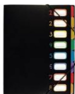
1 trieur avec 8 compartiments