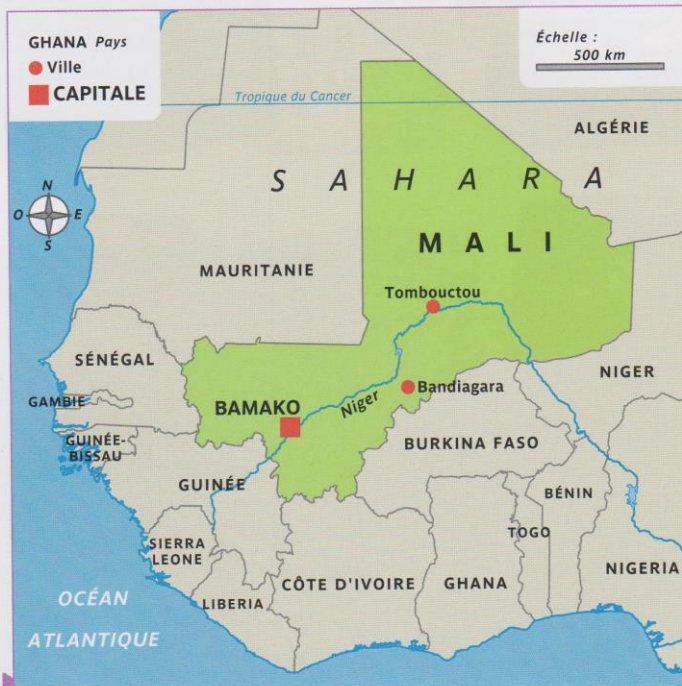
Doc. 1 Carte du Mali et des pays proches