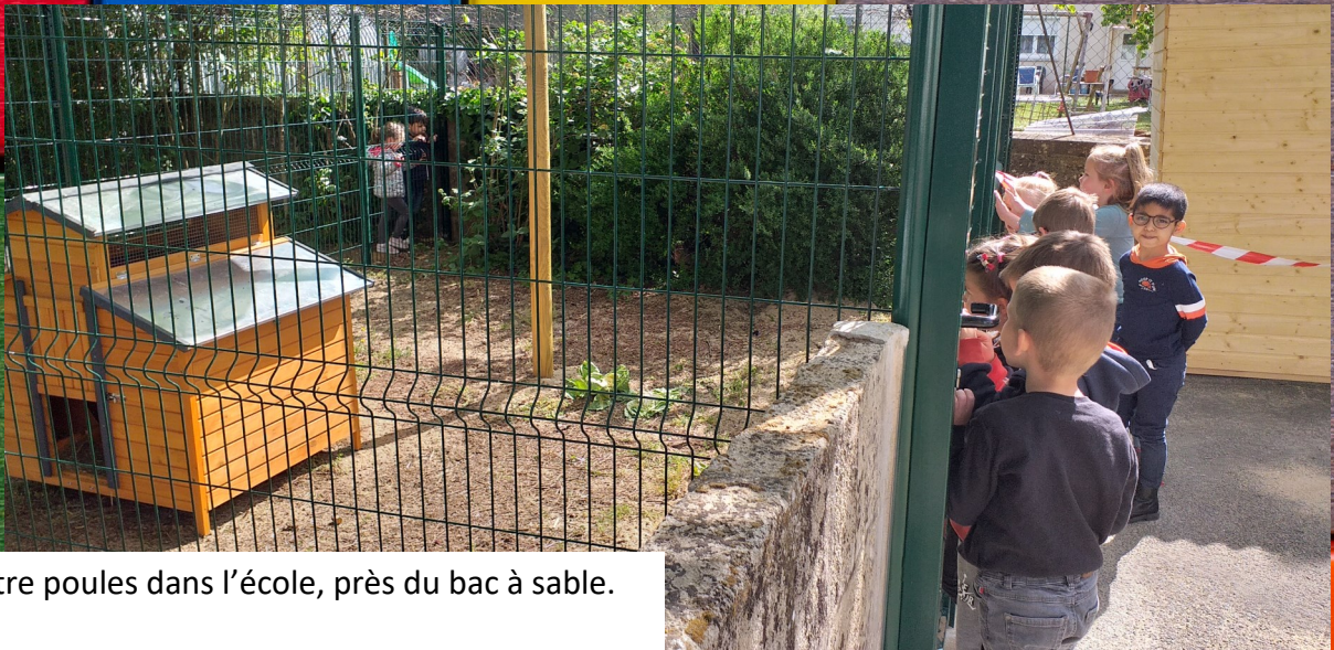
Il y a quatre poules dans l'école, près du bac à sable.