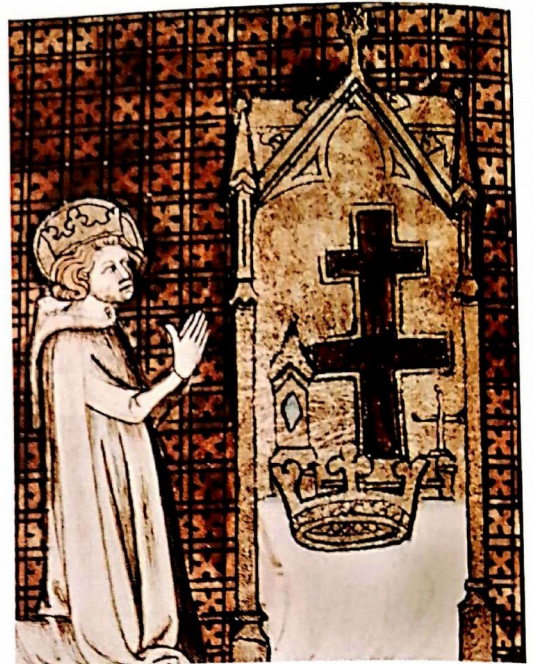
Doc. 3 Saint Louis (Louis IX) en prière

Le roi est entouré des grands seigneurs du royaume et d'évêques. Il reçoit l'onction. Cette cérémonie montre que le pouvoir du roi vient de Dieu.