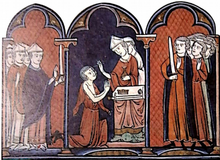
Doc. 2 Le sacre du roi à Reims (↪ carte p.51)

Miniature de L'Ordo du sacre de 1250. Bibliothèque nationale de France.