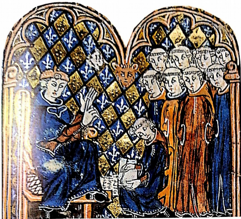
Doc. 5 Un bailli rendant une décision de justice

Miniature extraite de Philippe de Beaumanoir, Coutume de la comté de Clermont en Beauvaisis . Bibliothèque nationale de France.