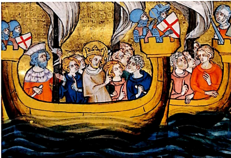
Doc. 4 Saint Louis arrive à Nicosie, Chypre, lors de la 7 e croisade

Miniature extraite de Vie et Miracles de Saint Louis , XIV e siècle. Bibliothèque nationale de France.