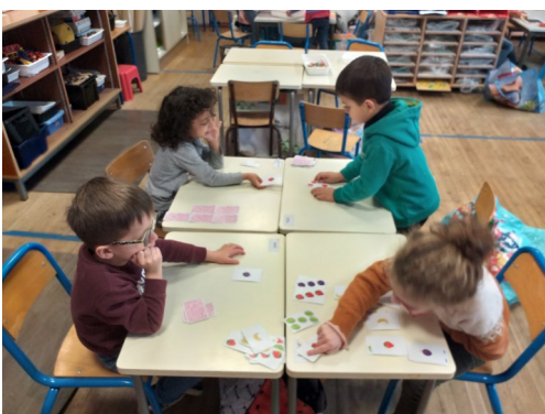
Maths - Jouer à Halli Galli - Adaptations pédagogiques pour l'autisme (pedagogieautisme.fr) etc...