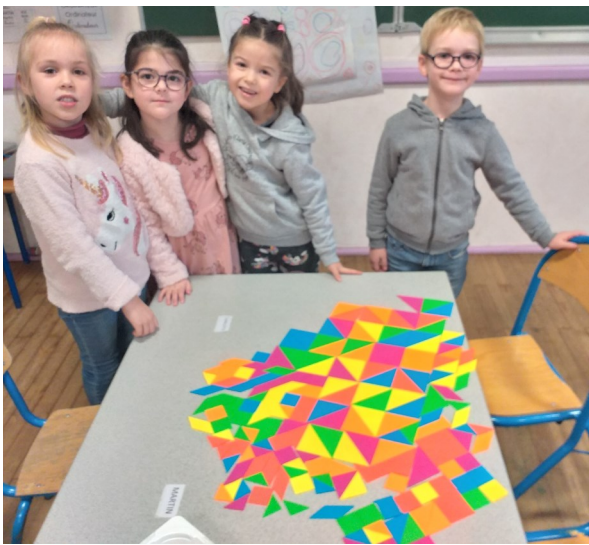
Le jeu des galettes 02- Le jeu des galettes MS - Webécoles - Bièvre-Valloire (ac-grenoble.fr)