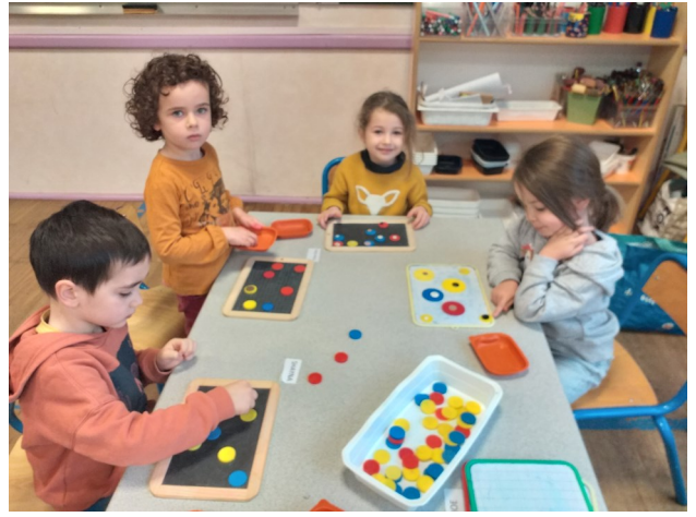
Les jeux: le TIC TAC TOE espace le jeu du tic tac toe.pdf (ac-grenoble.fr)