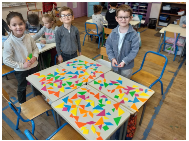
Les formes: mosaïques avec les cotés de même longueur ou les sommets et les cotés