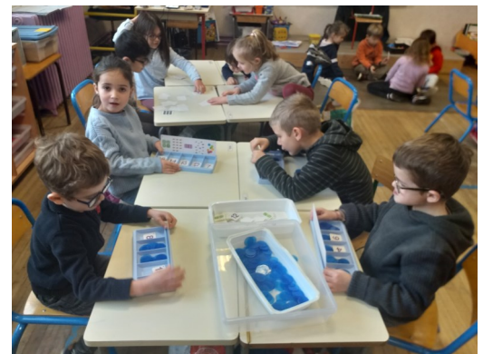
Le jeu Halli Galli, la bataille, les boîtes à nombres, les boîtes alignées...etc Diapositive 1