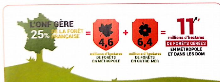
Doc. 5 Un acteur pour la protection de la forêt en France (extrait du site de l'ONF)

Premier gestionnaire d'espaces naturels en France, l'Office National des Forêts rassemble près de 10 000 professionnels. Leurs missions sont de répondre aux besoins de la population française grâce à la production et à la récolte de bois, préserver l'environnement et accueillir le public.