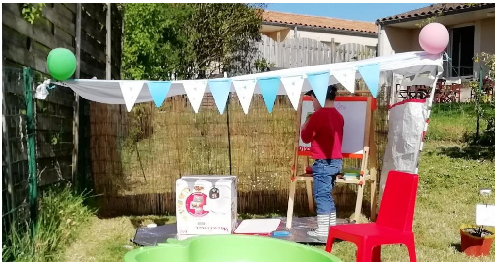
Les cabanes des Moyens