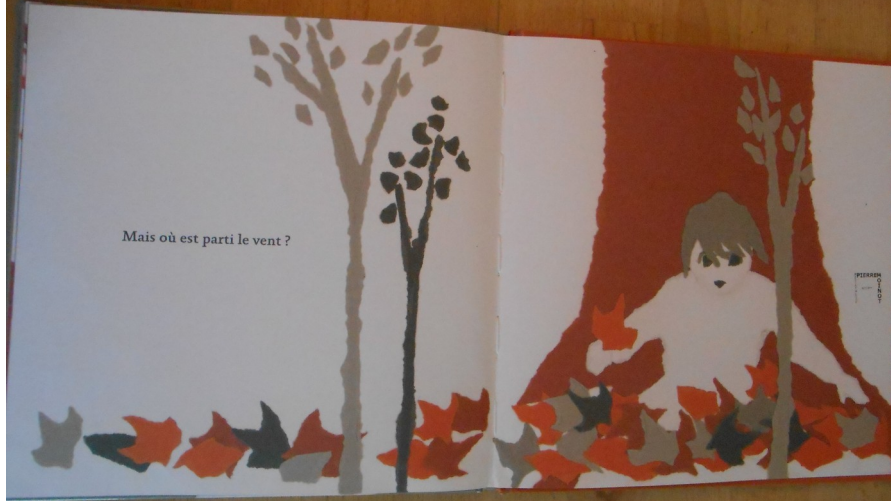
Illustration de Cécile Lévesque