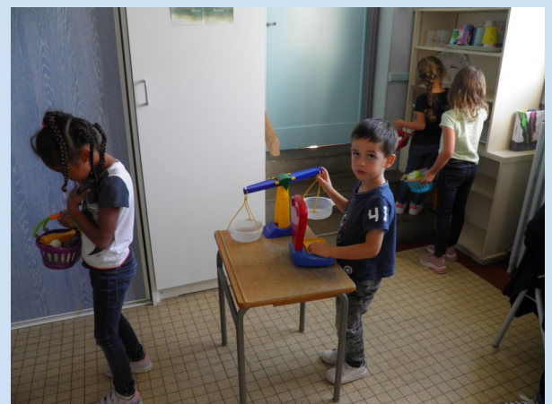
Le magasin de fruits et de légumes