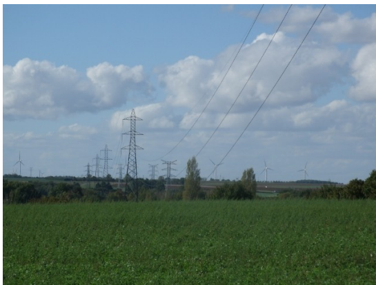
Au loin, nous avons vu les éoliennes.