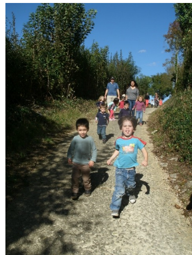
Dans le chemin des vallées, ça monte.....et ça descend.