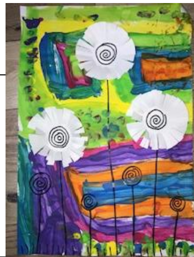
TABLEAU de FLEURS : 3 séances