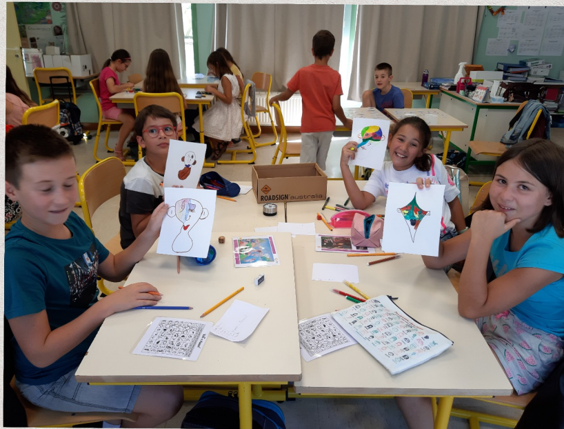
Arts Observation d'une œuvre Dessin à la manière de Picasso