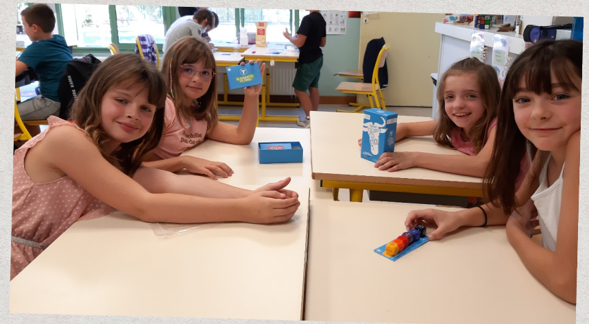
Langage oral « Comment j'ai adopté un gnou »