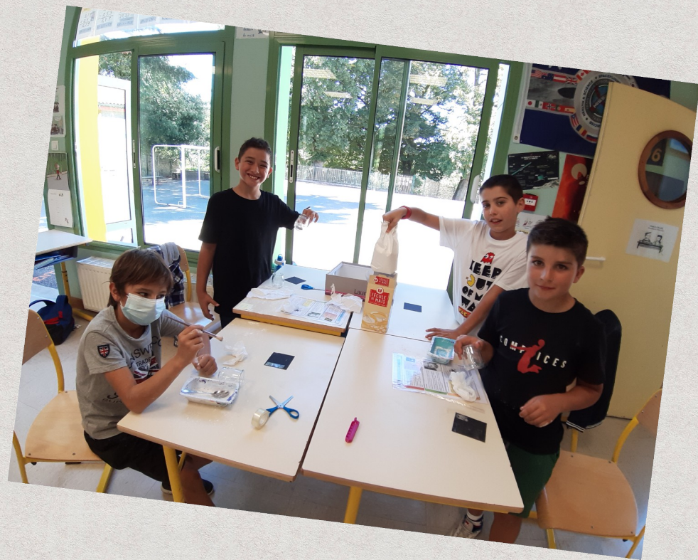
Sciences Les empreintes digitales