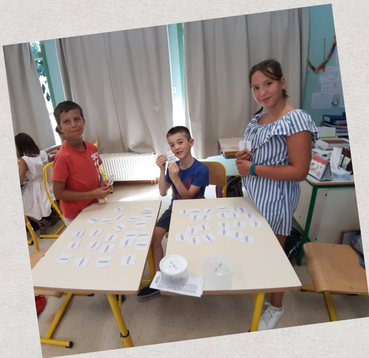
English Memory « Animals »